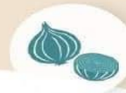
OIGNON ET AIL