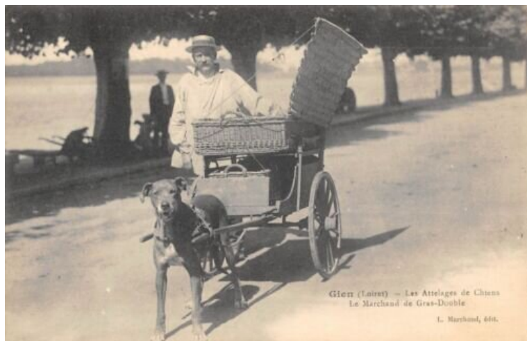
Marchand de gras double