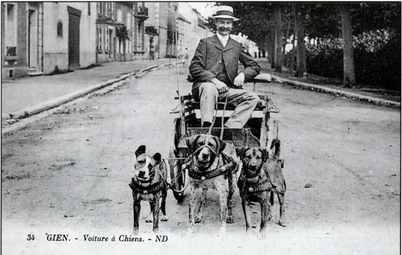
34 GIEN. - Voiture à Chiens.