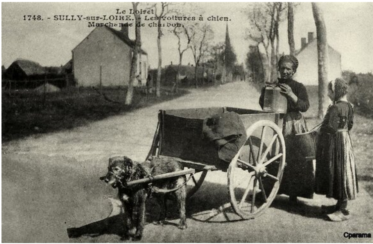
Marchande de charbon