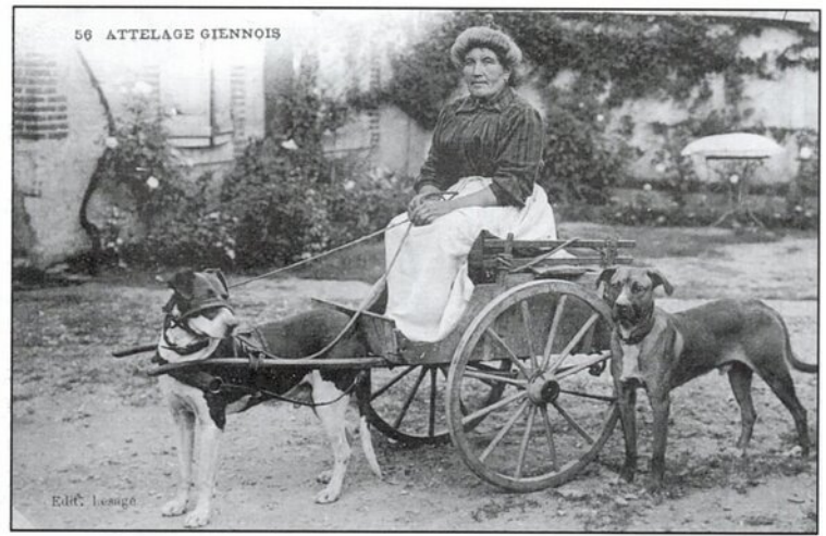
Marchande de Gras-double