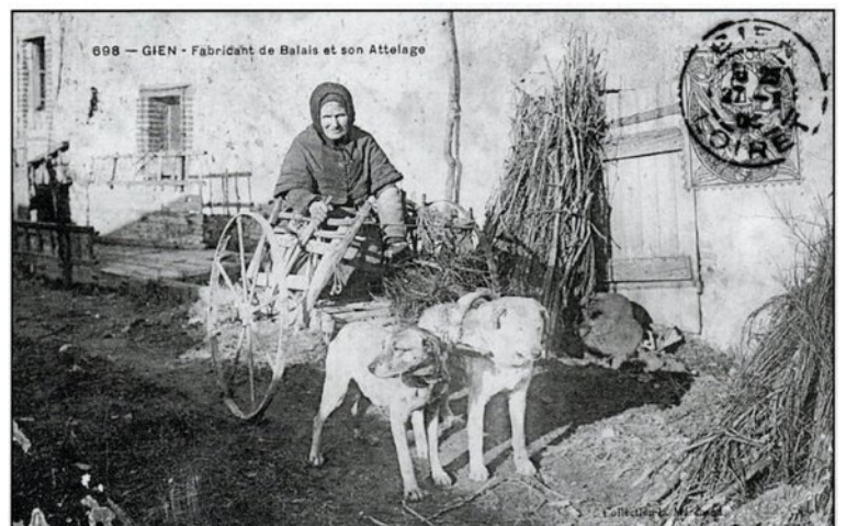
Marchande de balais