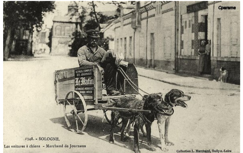
Marchand de journaux