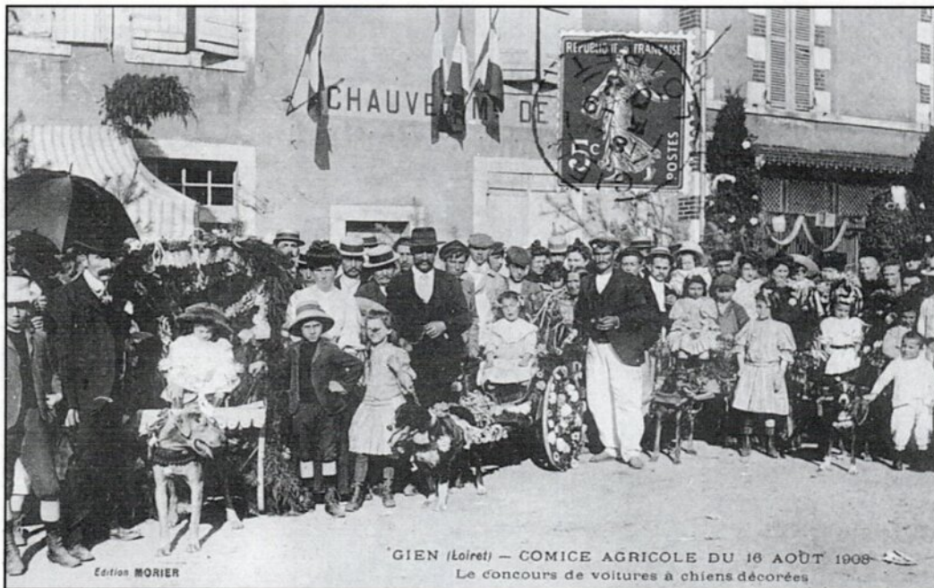
Concours de voitures à chiens décorées (Comice Agricole 1908)