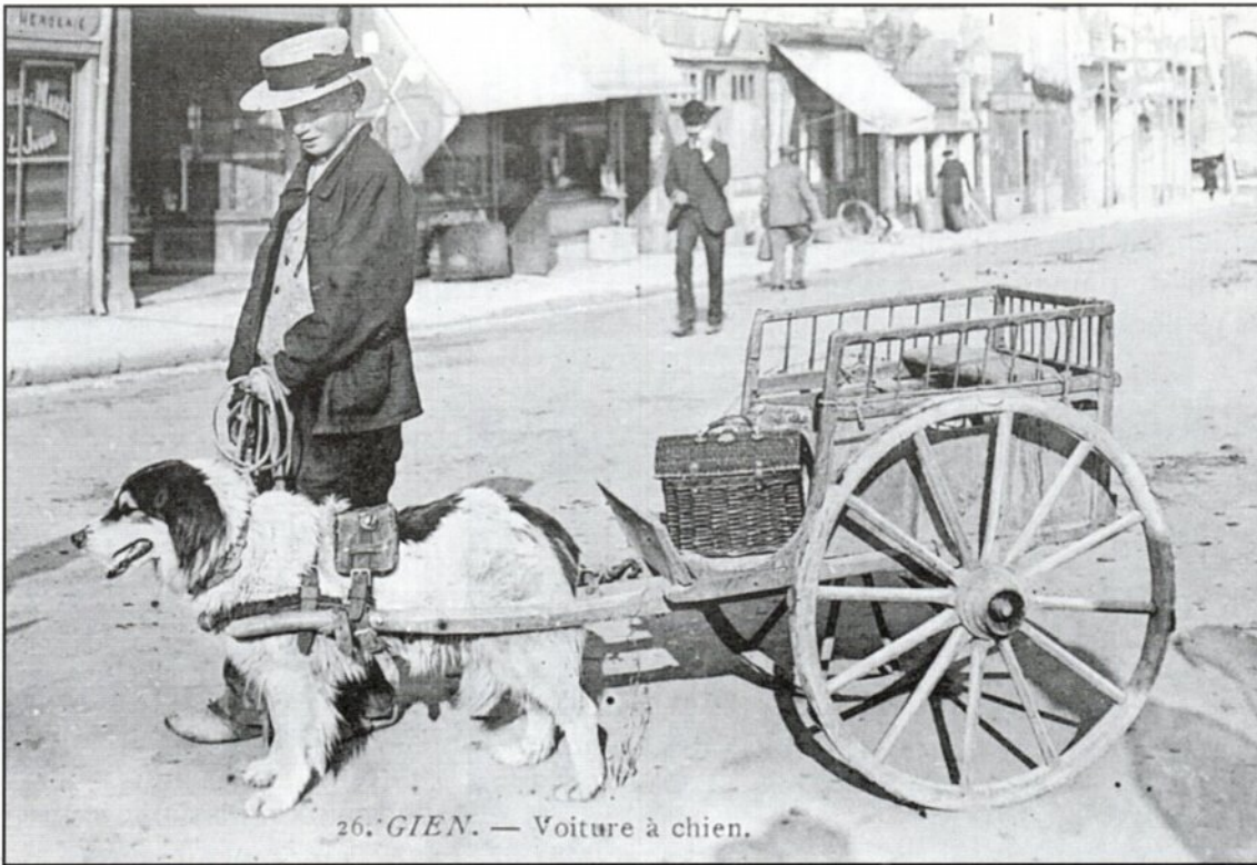
26. GIEN. — Voiture à chien.